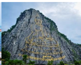
เขาชีจรรย์