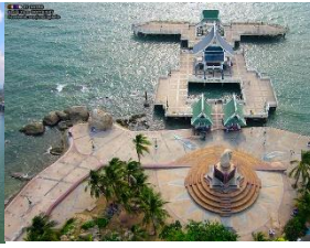
แหลมแท่น