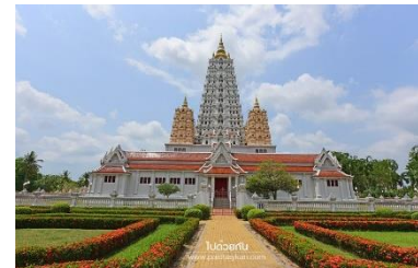
วัดญาณสังวรารามวชิรวิหาร