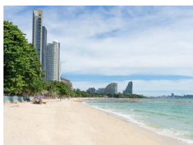
หาดพัทยา