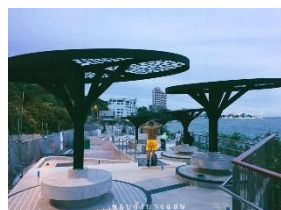
เขาสามมุข