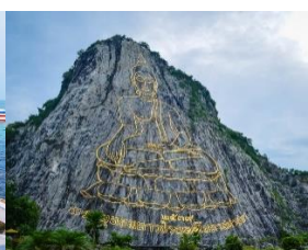
เขาชีจรรย์