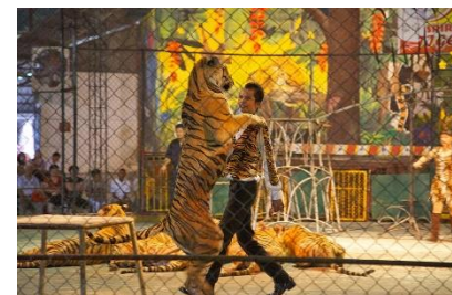
สวนเสือศรีราชา