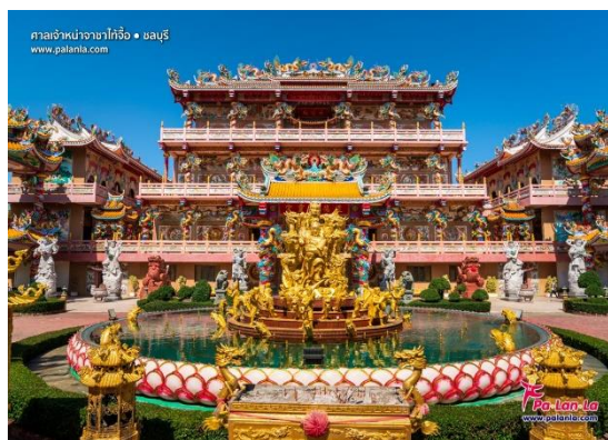
ศาลเจ้านาจาไท้จื้อ

ศาลเจ้านาจาไท้จื้อ ศาลเจ้านาจาชาไท้จื้อแต่เดิมเป็นเพียงศาลเจ้าเล็กๆ แต่ด้วยความเคารพศรัทธาของชาวบ้านและผู้ที่มากราบไหว้ ซึ่งมีความเชื่อกันว่าจะให้โชคทางด้านการค้า ทำให้มีผู้คนเข้ามาสักการะมากมาย และได้ถูกพัฒนาและปรับปรุงพื้นที่เรื่อยมา จนในปัจจุบันก็กลายเป็นศาลเจ้าเงินที่ใหญ่โตสวยงามตระการตา อาคารต่างๆ ในศาลเจ้าสร้างด้วยศิลปะแบบจีน มีความวิจิตรงดงามของสถาปัตยกรรม รูปปั้นเทวรูป มีองค์เทพเจ้าปางต่างๆ มากมายให้บูชาเพื่อความเป็นสิริมงคล ส่วนใหญ่คนที่มากราบไหว้มักจะมาขอเกี่ยวกับการงาน ให้ประสบความสำเร็จ และเรื่องของสุขภาพ อีกทั้งที่นี่ยังเป็นสถานที่ในการแก้ปชงอีกด้วย