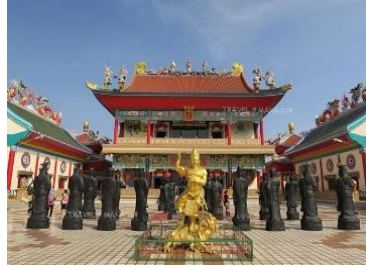
วิหารเซียน