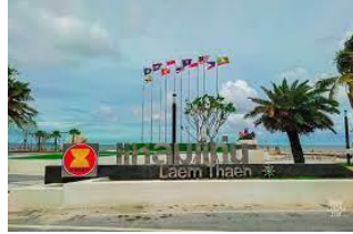
แหลมแท่น