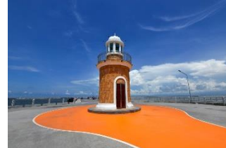
อ่างศิลา