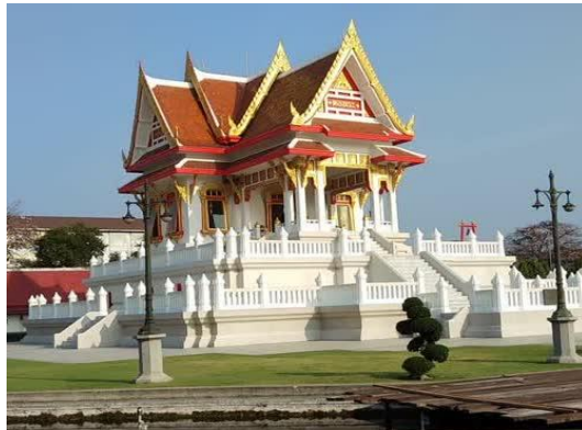
พระพุทธสิหิงค์มิ่งมงคลสิรินาถ

พระพุทธสิหิงค์มิ่งมงคลสิรินาถ พระพุทธรูปคู่บ้านคู่เมืองที่ชาวชลบุรีได้พร้อมใจกันสร้างขึ้น เมื่อปี พ.ศ. 2509 ประดิษฐานอยู่ ณ พอพระริมถนนวิชิรปราการ ห่างจากศาลากลางจังหวัด 500 เมตร พระพุทธสิหิงค์องค์นี้เป็นองค์จำลองมาจากองค์จริง เป็นที่เคารพสักการะของชาวชลบุรี