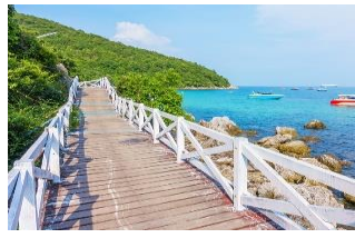
เกาะล้าน