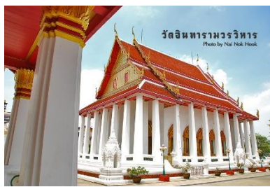
วัดใหญ่อินทาราม