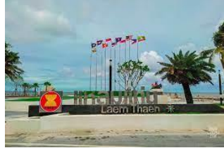
แหลมแท่น