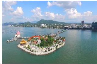
เกาะลอยศรีราชา