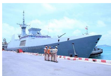
ฐานทัพเรือสัตหีบ