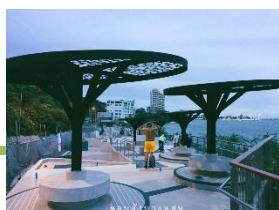
เขาสามมุข