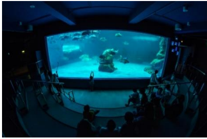
สถาบันวิทยาศาสตร์ทางทะเล