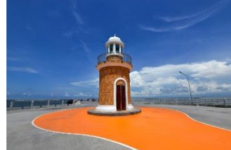
อ่างศิลา