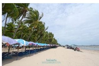
หาดบางแสน