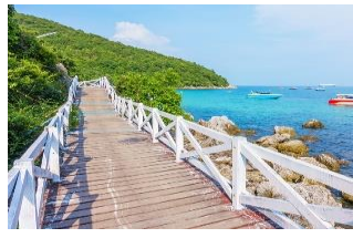
เกาะล้าน