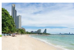
หาดพัทยา