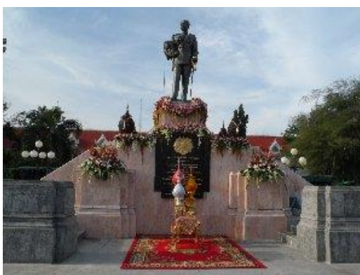
พระบรมราชานุสาวรีย์รัชกาลที่ 5

พระบรมราชานุสาวรีย์รัชกาลที่ 5 ประดิษฐานอยู่ที่หน้าศาลากลางจังหวัดชลบุรี พระบาทสมเด็จพระเจ้าอยู่หัวเสด็จพระราชดำเนินมาทรงเปิดเมื่อวันที่ 15 พฤศจิกายน พ.ศ. 2511 ปัจจุบันประชาชนได้พร้อมกันทำพิธีบวงสรวงทุก ๆ เย็นวันอังคาร