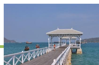
เกาะสีชัง