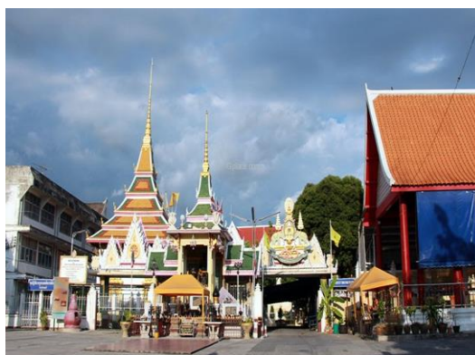
วัดใหญ่อินทาราม

วัดใหญ่อินทาราม ตั้งอยู่ที่ถนนเจตจันทร์ในตัวเมืองชลบุรี สันนิษฐานว่าสร้างมาตั้งแต่สมัยอยุธยาตอนปลาย มีภาพเขียนเก่าเรื่องทศชาติชาดกและพลับพลาตรีมุขเก่าแก่สร้างด้วยไม้มีพระพุทธรูปสำริดทรงเครื่องกษัตริย์งดงาม เรียกกันว่า "หลวงพ่อเฉย"