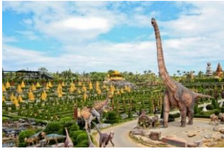
สวนนงนุช