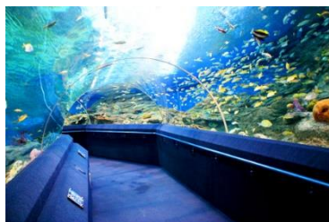
Underwater World พัทยา