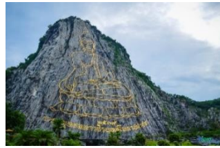
เขาชีจรรย์