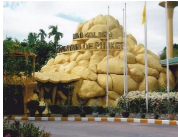
สวนผีเสื้อสายทิพย์