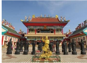
วิหารเซียน