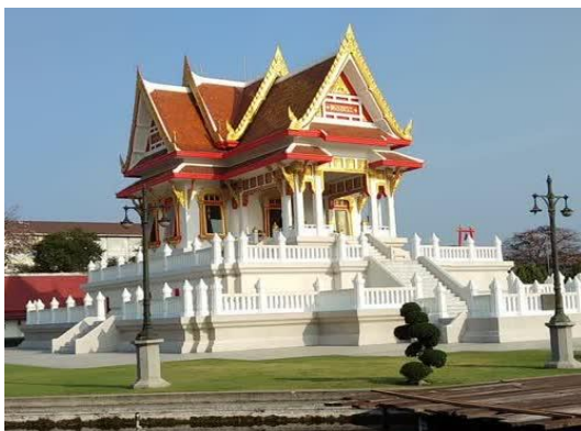
พระพุทธสิหิงค์มีงมกลสิรินาถ

พระพุทธสิหิงค์มีงมกลสิรินาถ พระพุทธรูปคู่บ้านคู่เมืองที่ชาวชลบุรีได้พร้อมใจกันสร้างขึ้น เมื่อปี พ.ศ. 2509 ประดิษฐานอยู่ ณ พอพระริมถนนวิชิรปราการ ห่างจากศาลากลางจังหวัด 500 เมตร พระพุทธสิหิงค์องค์นี้เป็นองค์จำลองมาจากองค์จริง เป็นที่เคารพสักการะของชาวชลบุรี