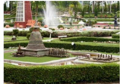
เมืองจำลอง