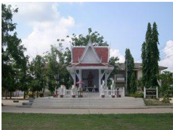
เมืองพญาเร่

“เมืองพญาเร่” ตั้งอยู่ในเขตตำบลบ่อทอง อำเภอบ่อทอง เป็นเมืองยุคทวารวดีเช่นเดียวกับเมืองพระรถ เมืองนี้ตั้งอยู่ในเขตที่สูง ห่างจากเมืองพระรถประมาณ 32 กิโลเมตร ลักษณะผังเมืองเป็นรูปวงรี 2 ชั้น ชั้นแรกมีเส้นผ่าศูนย์กลางประมาณ 1,100 เมตร ส่วนชั้นในประมาณ 600 เมตร โดยคูเมืองและคันดินของตัวเมืองชั้นนอกทางด้านเหนือยังคงปรากฏเห็นได้ชัดเจนในปัจจุบัน เมืองพญาเร่มีการติดต่อกับเมืองพระรถอยู่เนืองๆ โดยใช้คลองหลวงเป็นเส้นทางสัญจร ปัจจุบันลำคลองนี้ยังคงอยู่ โดยเป็นคลองสายสำคัญและมีความยาวที่สุดของจังหวัดชลบุรี ทุกวันนี้การทำนาในอำเภอนนทบุรีและอำเภอบางบัวทอง ยังคงอาศัยน้ำจากคลองนี้ เนื่องจากมีแควหลายสายแตกสาขาออกไป แควใหญ่ที่สุด คือ แควที่เกิดจากทิวเขาป่าแดง