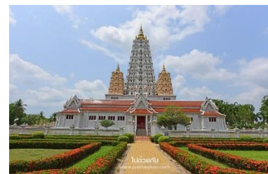
วัดญาณสังวรารามวชิรวิหาร