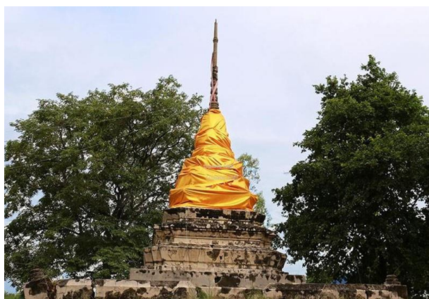
เมืองพระรถ

ในสมัยทวารวดีและสมัยลพบุรี ประมาณ 1,400 - 700 ปีก่อน บริเวณตำบลหน้าพระธาตุ อำเภอพนัสนิคมในปัจจุบัน มีร่องรอยของเมืองใหญ่ชื่อ “เมืองพระรถ” ตั้งอยู่ที่ราบลุ่มซึ่งแม่น้ำหลายสายไหลมาบรรจบกันเป็นแม่น้ำพานทอง โดยสามารถใช้แม่น้ำสายนี้เป็นทางคมนาคมติดต่อกับเมืองศรีมโหสถในจังหวัดปราจีนบุรี (ปัจจุบันคือบริเวณบ้านสระมะเขือ บ้านโคกวัด และบ้านหนองสะแก อำเภอศรีมโหสถ) จนไปถึงอำเภออรัญประเทศได้ อีกทั้งยังมีเส้นทางเดินเท้าเชื่อมไปถึงจังหวัดระยองและจันทบุรี ผ่านเมืองพญาแร่ซึ่งเป็นเมืองโบราณสำคัญอีกแห่งหนึ่งของชลบุรี เมืองพระรถจึงกลายเป็นศูนย์กลางการคมนาคมของชลบุรีในยุคนั้น นอกจากนี้ นักโบราณคดียังสำรวจพบว่าเมืองพระรถเป็นเมืองโบราณยุคเดียวกับเมืองศรีพโล หรือเก่ากว่าเล็กน้อย เนื่องจากปรากฏว่ามีทางเดินโบราณเชื่อมต่อสองเมืองนี้ในระยะทางประมาณ 20 กิโลเมตร