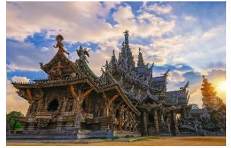
ปราสาทสัจธรรม